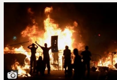
Fala antyrządowych protestów w Brazylii