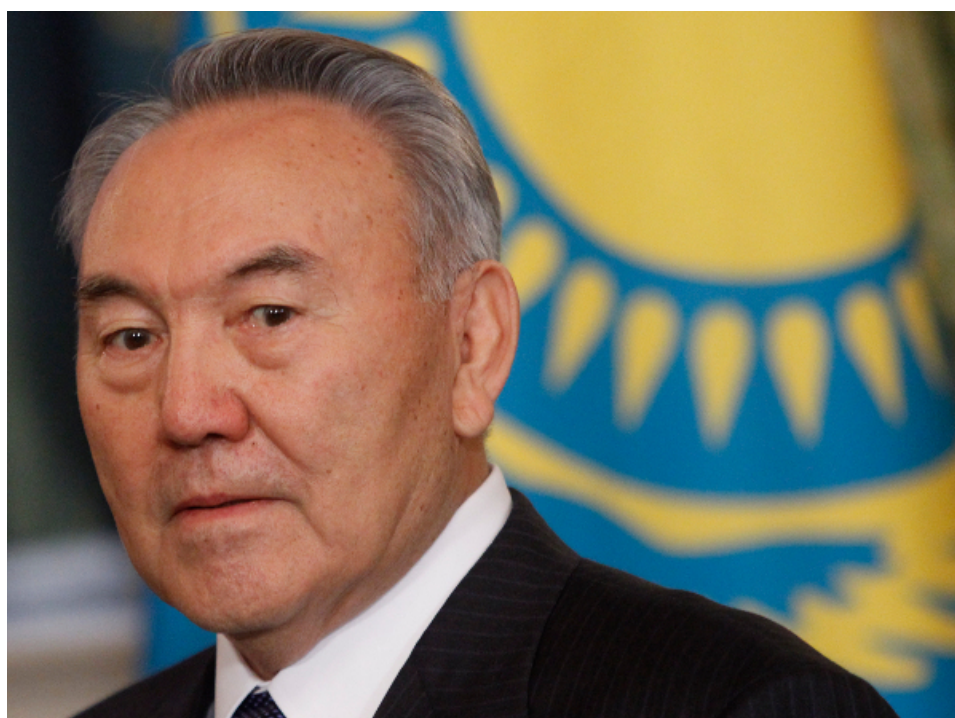
Nursułtan Nazarbajew